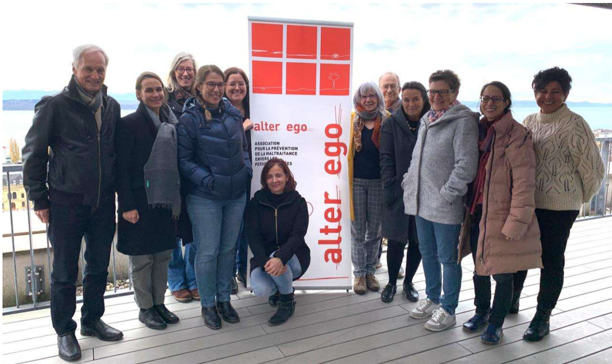
Une partie des membres de l'équipe d'alter ego lors de la Journée au vert à Neuchâtel

Les membres du Comité d'alter ego ayant une activité professionnelle en dehors de l'association et provenant de différentes régions de Suisse romande, les séances ont lieu régulièrement en ligne. Par ailleurs, l'ensemble de l'équipe se retrouve lors de temps forts comme le sont l'Assemblée générale annuelle et une Journée au vert organisée cette année le 20 novembre à Neuchâtel.