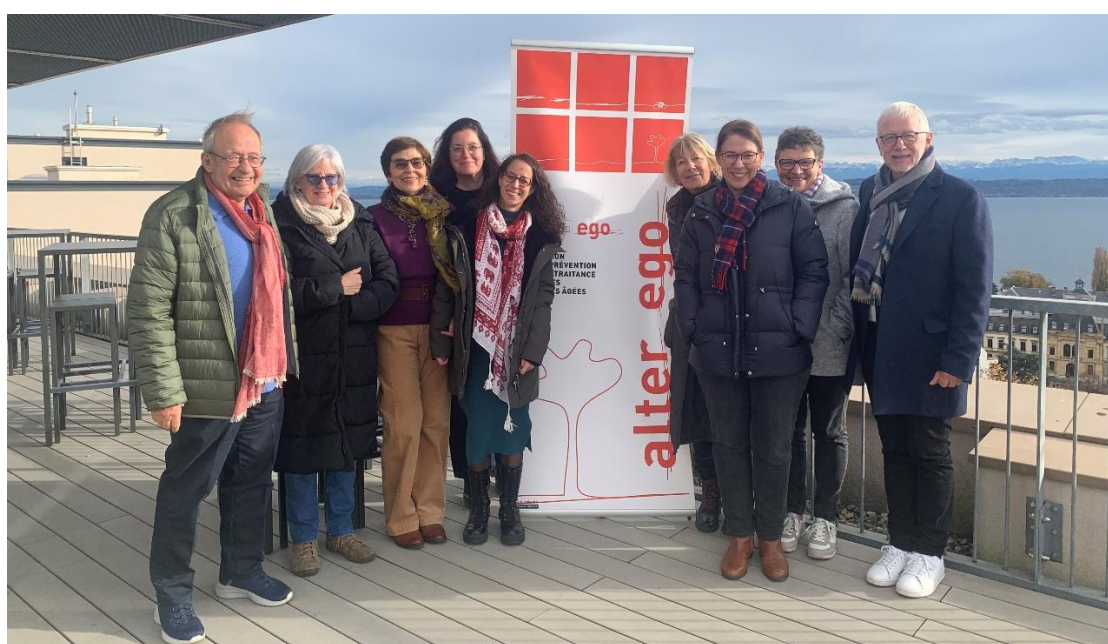
Une partie des membres de l'équipe d'alter ego lors de la Journée au vert, le 18 novembre 2024, à Neuchâtel

L'équipe est complétée par trois personnes salariées, à temps partiel. Celles-ci assurent le bon fonctionnement de ses prestations.