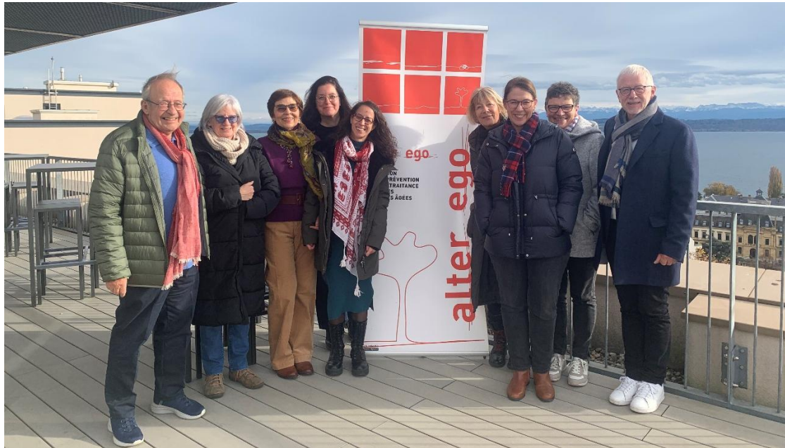
Une partie des membres de l'équipe d'alter ego lors de la Journée au vert, le 18 novembre 2024, à Neuchâtel

L'équipe est complétée par trois personnes salariées, à temps partiel. Celles-ci assurent le bon fonctionnement de ses prestations.